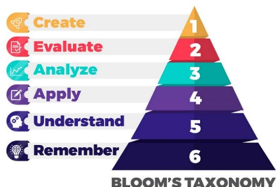
Εικόνα 1. Ταξινόμηση του Bloom

→ Η μεθοδολογία που επιλέχθηκε για την ανάπτυξη των μαθησιακών αποτελεσμάτων του FWSS είναι η ταξινόμηση του Bloom, η οποία αναλύεται σε έξι επίπεδα στόχων, όπως φαίνεται στην εικόνα: